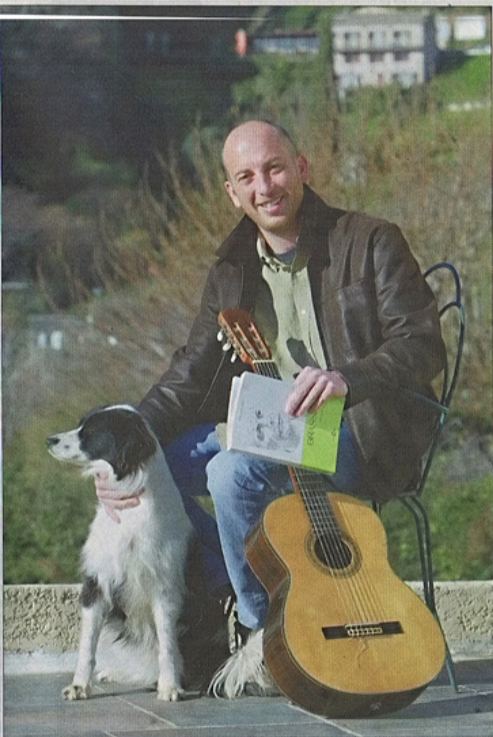
« Je gratte un peu sur ma guitare pour suivre les mélodies, ce qui s'est révélé très utile. Mais je ne suis en aucun cas musicien ou chanteur ! »